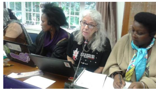
Delegada de CADTM