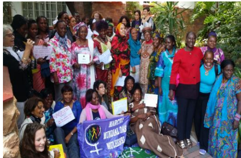
Participantes del Encuentro Africano