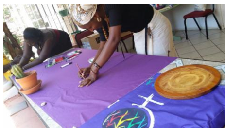
Pintando nuestros baners

Internacional nos ofrece en la consolidación y expansión de la MMM. Juntas en plenaria y separadas en grupos trabajo, las compañeras africanas planificamos nuestras estrategias de coordinación y movilización para el 2015.