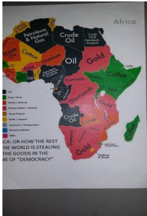
Mapa de los recursos naturales en África