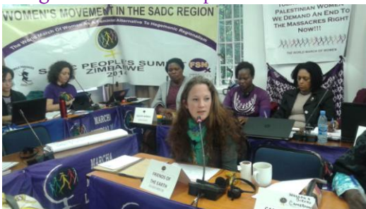
Delegada de Amigos de la Tierra Internacional

Delegadas de algunas organizaciones aliadas como Amigos de la Tierra Internacional, La Vía Campesina y CADTM también participaron en el encuentro con objetivo de buscar convergencias y reforzar nuestras alianzas en el continente africano