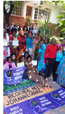
Participantes del Encuentro Africano