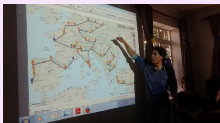
Delegada europea explicando el recorrido de la caravana europea para la 4ª Acción Internacional.