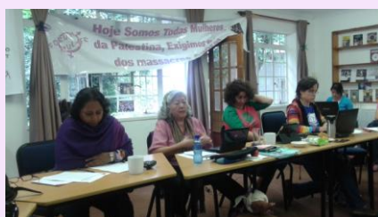
Reunidas en plenaria