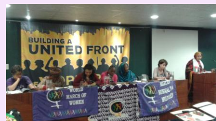
Compañeras en la plataforma pública de NUMSA