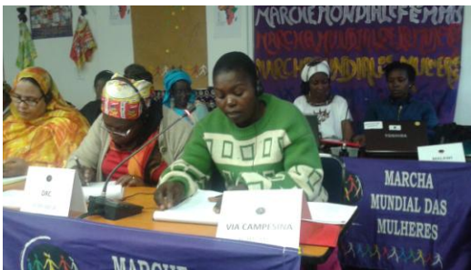
Delegada de La Vía Campesina