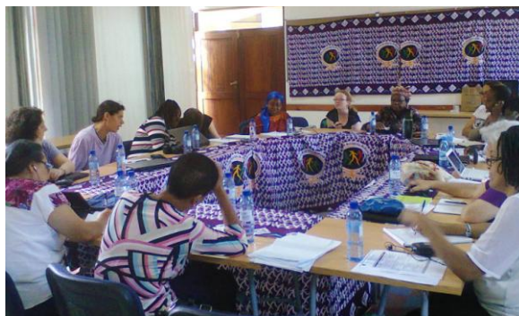
Comité International réuni à Maputo

Nous prétendons, une fois encore, affirmer nos alternatives vers la construction d'une société qui ait le bien-être de nous toutes et tous au sein de ses soucis. On propose aussi de relier le thème avec les luttes historiques du mouvement féministe. Une déclaration et des orientations spécifiques sur les 24 heures sont en cours