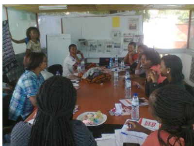
Réflexion sur comment les médias contribuent à perpétuer le patriarcat

A la fin de la rédaction de ce bulletin, nous avons su, d'après l'information de nos camarades du Mozambique, que le Président de la République a rejeté au Parlement le projet de loi. Une nouvelle victoire de la mobilisation!