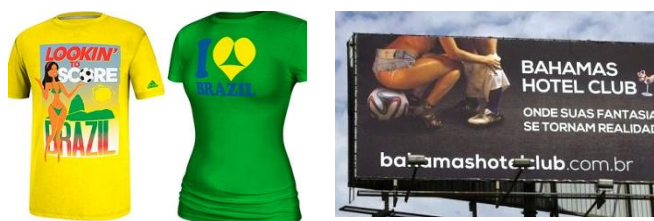
Exemples de publicité sexiste et machiste diffusée durant le Mondial.

La mise en question de la transformation des femmes en objet, transmise par la publicité sexiste pour la vente de biens ainsi que la promotion du tourisme pour la consommation sexuelle des hommes, ont été un axe fondamental des débats et actions que la MMF au Brésil a développé les derniers mois pendant le championnat de football, fini le 13 juillet.