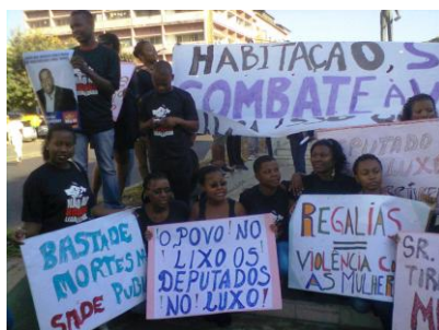
Slogans et matériel pour la mobilisation contre les privilèges abusifs des députés