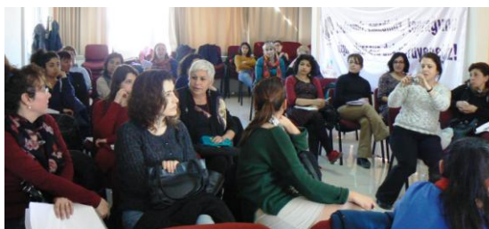
Réunion nationale de la MMF, à Ankara, Turquie

Au niveau régional, du 10 au 12 octobre 2014 aura lieu à Donostia (Saint Sébastien), Pays Basque, la Rencontre Européenne , qui fournira les derniers détails de la caravane féministe européenne qui voyagera le long