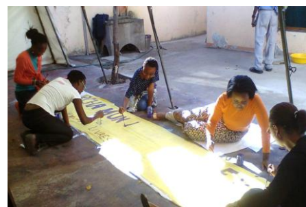
Les participantes préparent également du matériel pour la mobilisation du 28 mai