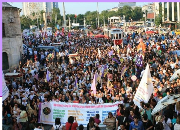
Manifestación europea de la MMM en Istanbul - Junio 2010

En el 2010 se realizó la tercera acción internacional de la Marcha Mundial. En Europa, diferentes acciones fueron llevadas a cabo en Francia, País Vasco, Galicia, Portugal, Grecia, Suiza, Polonia, Turquía, Macedonia, Chipre, Italia, en los países balcánicos... La acción europea en Istanbul reunió 3000 mujeres des 22 países.